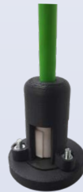
Abbildung 3: 3D-gedruckte Prüfvorrichtung

Abbildung 3 zeigt eine Prüfvorrichtung, die im Zusammenhang mit Dichtigkeitsprüfungen verwendet wurde. Die zu betrachtende Funktionsgrenze verlief mitten durch eine Baugruppe, sodass die Untersuchung ohne eine solche Vorrichtung gar nicht präzise möglich gewesen wäre.